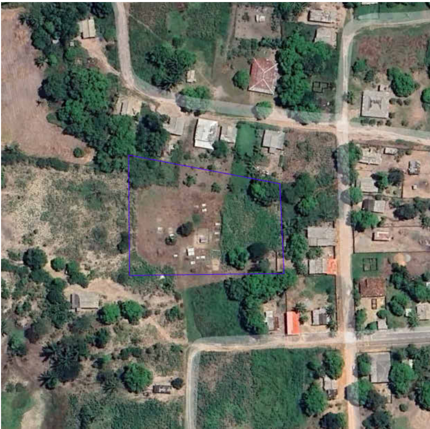
2 LOCALIZAÇÃO SEM ESCALA